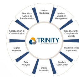
Abb.: Die zehn TRINITY Module im Überblick